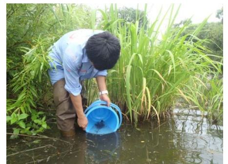
環境整備したCたんぽに約100尾放流