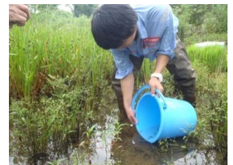
環境整備したBたんぽに約360尾放流

『トミヨ』は体長5～6cmの一年魚で、湧水があり、ミクリなど抽水植物の生い茂った『たんぽ』で巣をつくり命をつないでいます。