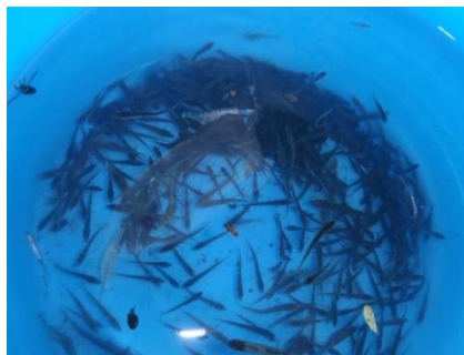
体長3cm前後の捕獲したトミヨの稚魚460尾