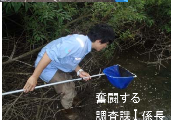
奮闘する 調査課Ⅰ係長