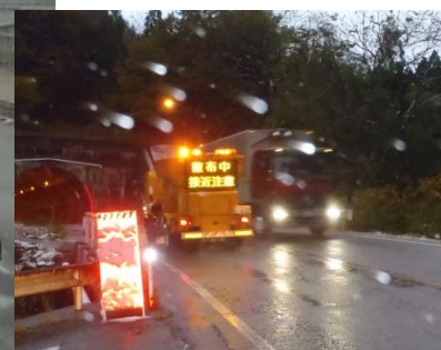
凍結防止剤散布車出動(村上市大須戸付近)