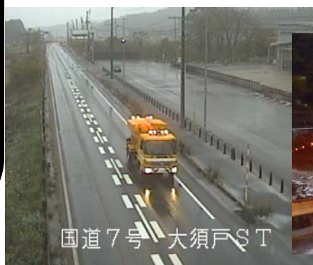
国道7号 大須戸S T

断続的な降雪で路面全体がシャーベット、気温、路温低下 早い降雪のため道路利用者の大半が普通タイヤの可能性大 スリップ事故、登坂不能の危険性 大