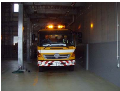
凍結防止剤の積み込み作業 (大須戸除雪ステーション)