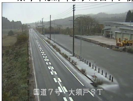
国道7号 大須戸S T