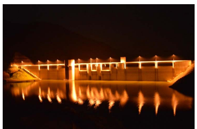
湖面に浮かぶダム