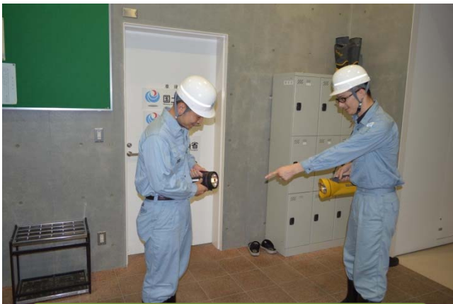
巡視前確認(装備等)