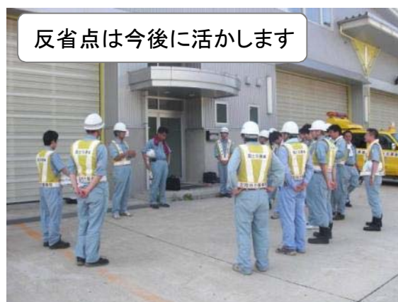
反省点は今後に活かします