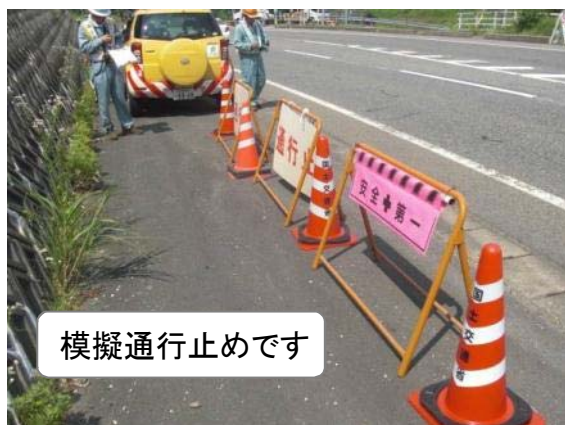
模擬通行止めです

通行止めを行う場合は、道路情報板や事務所ホームページなどで情報提供いたしますのでご確認ください。特に大雨などの異常気象時には十分ご注意ください。（担当：道路管理課）