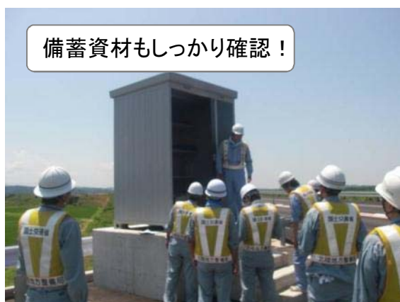
備蓄資材もしっかり確認！