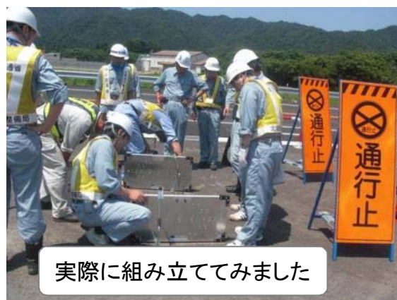
実際に組み立ててみました