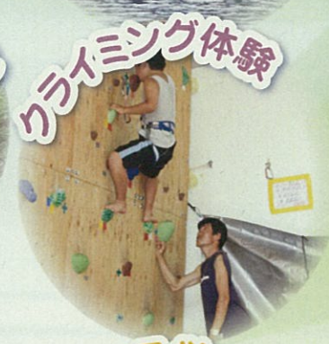
クライミング体験