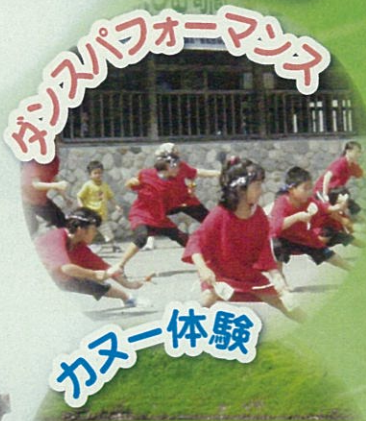
ダンスパフォーマンス