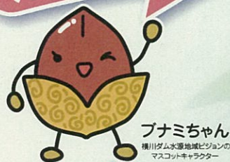
ブナミちゃん 横川ダム水源地域ビジョンの マスコットキャラクター