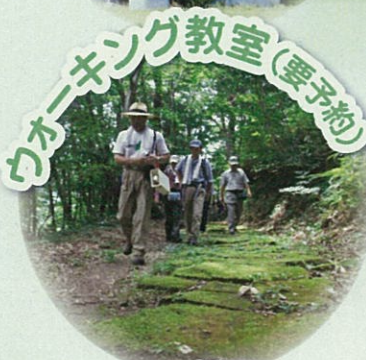
ウォーキング教室（要予約）