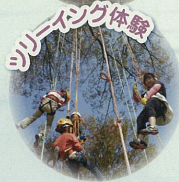
ツリーイング体験