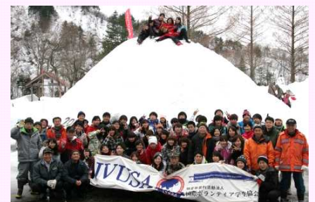
学生ボランティアの皆さん