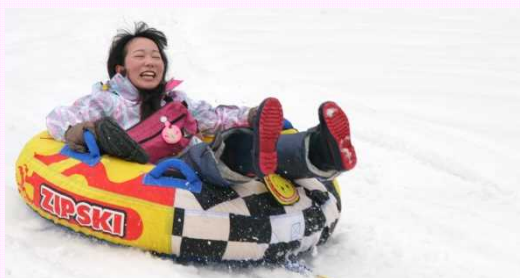
スノーモービルソリ遊び

巨大どもんこ体験の他、そり遊び、懐かしの竹スキー、ゴムチューブ、雪山探索など、貴重な体験を通じて雪を楽しみました。