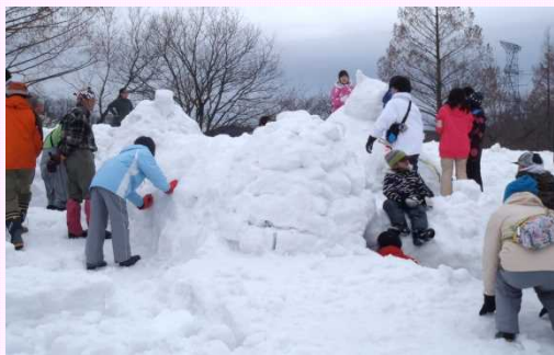
関川村長とイグルー作り☆体験

また、国際ボランティア学生協会から50人の大学生が全国各地から駆けつけ、若い力で大変盛り上がりました！！