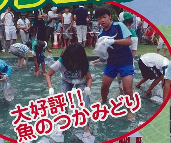
大好評!! 魚のつかみどり