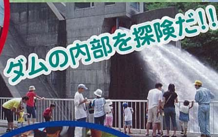
ダムの内部を探検だ!!