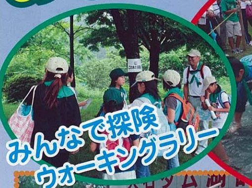
みんなで探検 ウォーキングラリー