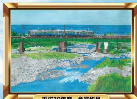
平成30年度 金賞作品

開催趣旨 「河川愛護月間」に併せて実施するもので、小学生の川に対する関心を深めるとともに、多くの人々に小学生の描いた川の絵をとおりて郷土の川の将来について考えてもらう機会を設けるものです。