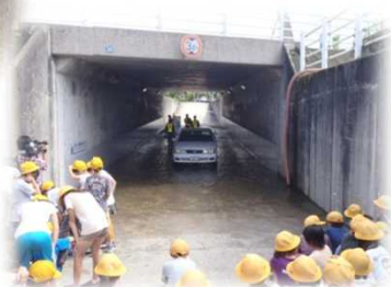
昨年度の訓練状況