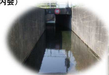
冠水した地下横断ボックスの事例