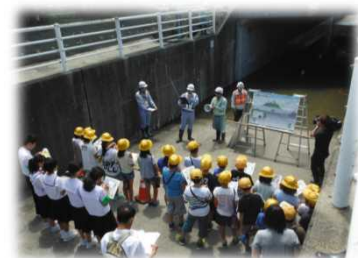
昨年度の訓練状況