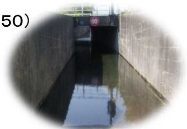
冠水した道路の事例

○実施内容：初動対応の確認 被災状況の確認 被災車両からの救助訓練 移動排水ポンプによる強制排水訓練 冠水時の注意事項説明