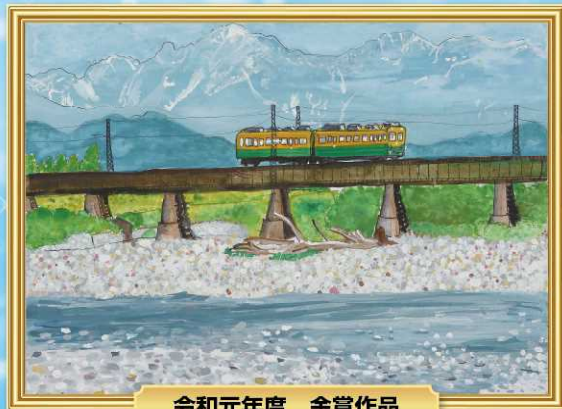
令和元年度 金賞作品

開催趣旨 「河川愛護月間」に併せて実施するもので、小学生の川に対する関心を深めるとともに、多くの人々に小学生の描いた川の絵をとoshて郷土の川の将来について考えてもらう機会を設けるものです。