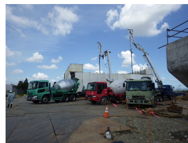
橋台コンクリート打設状況