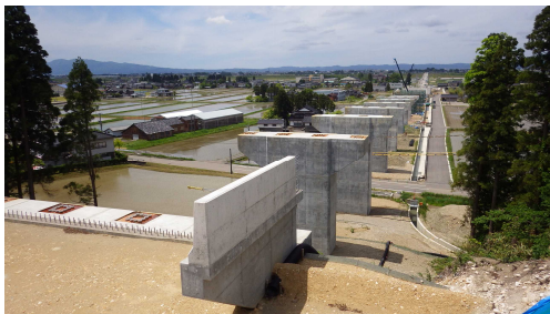
いかるぎの大橋下部工施工状況