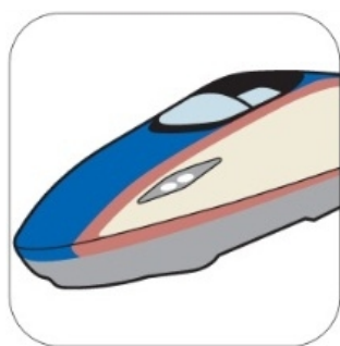
新型車両イメージデザイン