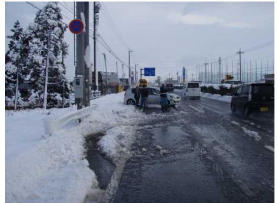
※平成22年の事故状況写真