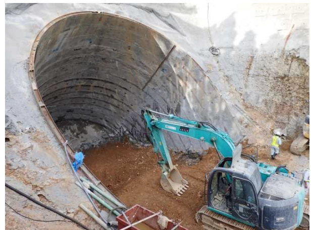
「斜め深礎杭」の施工状況