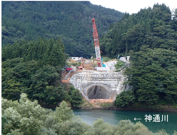
工事の状況(対岸から撮影)

日 時：平成29年9月13日(水) 14時00分～15時30分 ※小雨決行します。 開催場所：富山市舟渡地先 ※時間、場所の詳細は【別紙】をご参照ください。 参加者：富山市立 榆原中学校 生徒31名(1年生 4名、2年生 16名、3年生 11名)、 教職員 9名