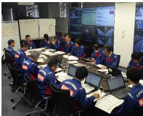
【令和元年度の訓練状況】

国土交通省 富山河川国道事務所 道路情報管理室（5階） （各機関はそれぞれの職場にて参加しますので、 富山河川国道事務所には参集しません。）