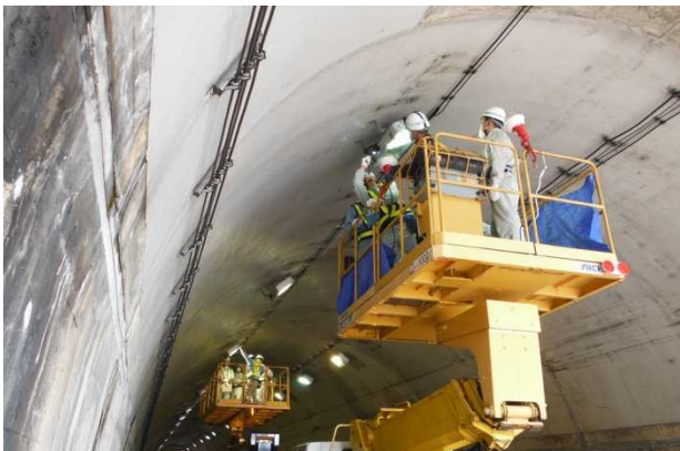
(高所作業車による点検状況)