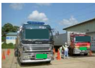
【過去の取締り 状況写真】