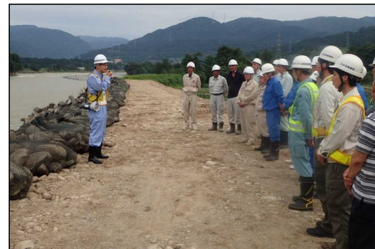
工事関係者に謝意を述べる福濱事務所長