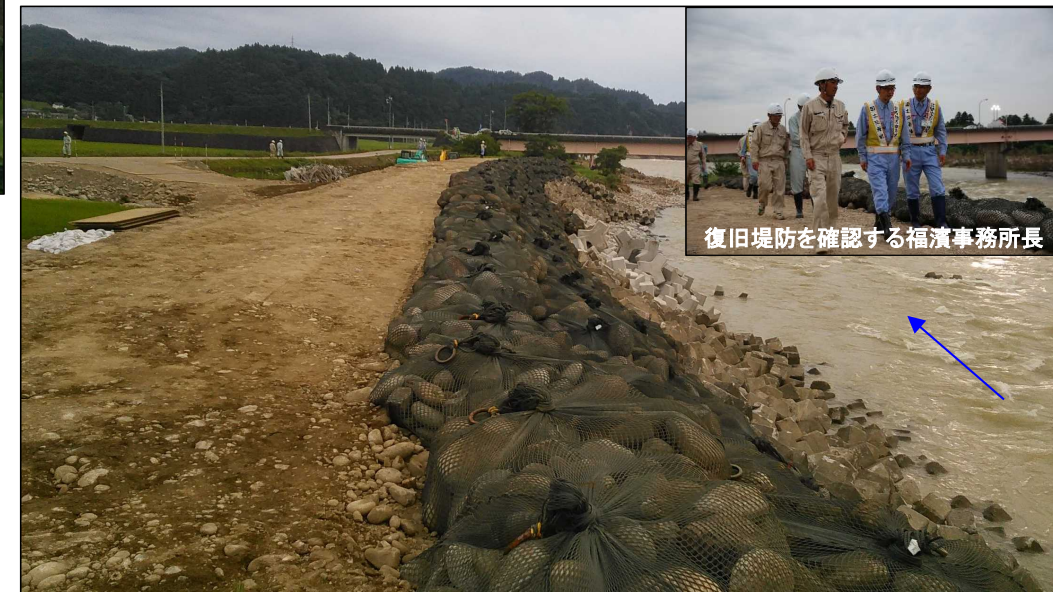
復旧した堤防(上流から下流を望む)