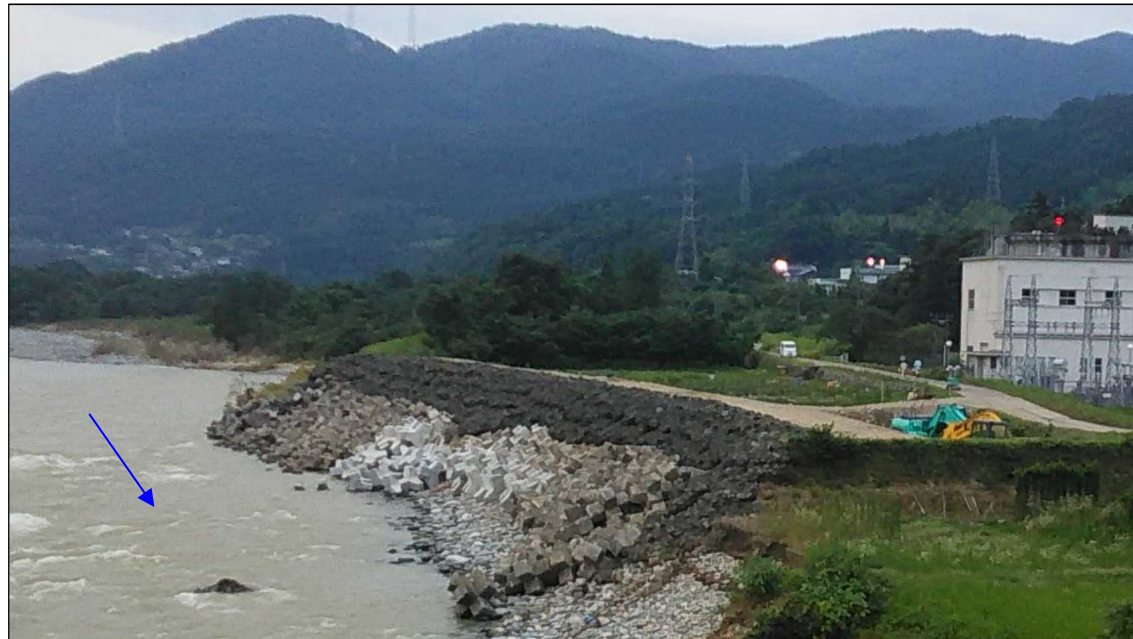
復旧が完了した堤防(平成30年7月11日(水)18:30)