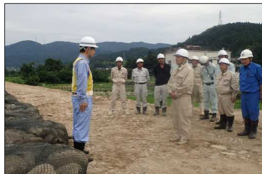
復旧完了報告を行う工事関係者代表