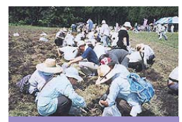
【らっきょう体験掘りフェア】