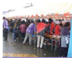
【ぶり・ノーベル出世街道祭り】