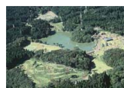
【割山森林公園 天湖森】