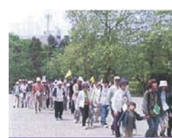
【ノーベル街道ウォークラリー】