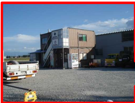
笹嶋工業現場事務所