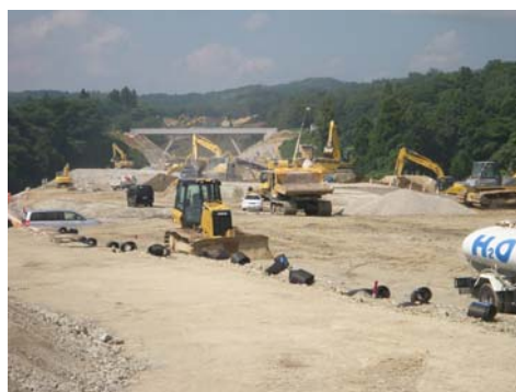
氷見市脇地区 大規模盛土工事現場