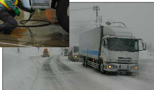
▲登坂不能車発生状況（国道41号富山市庵谷地先）

※当日の気象状況により延期する場合があります。 (延期の場合：12月18日（金）開催)