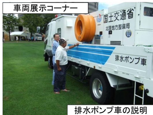
車両展示コーナー

8月22日(土)と23日(日)に、クロスランドおやべで開催されました。(主催者発表で2日間で約2万人の来場者) ヘリコプターは官民合わせて8機が飛来し、富山県消防防災ヘリによる救助訓練や自衛隊の音楽演奏、パネル展他、各種イベントが盛りだくさん。富山河川国道事務所からは、災害対策用車両の展示、パネル展示を行い、その中で、七尾氷見道路・入善黒部バイパスが全線開通して約6ヶ月、災害時を含めた道路の整備効果等についてPRしました。 アンケートの実施も行い、回答者の方に非常食1個を配布いたしました。(賞味期限が近いもの)アンケートでは、約96%の方が「パネル展を今後も継続してほしい」との事でしたので、その他意見とあわせ参考とさせていただきます。 車両展示コーナーでは、除雪トラック、ロータリー除雪車、排水ポンプ車、照明車を展示し、除雪トラックとロータリー除雪車は、運転席に座らせて記念写真を撮る家族連れの方が多く見られました。 地域住民の方に接して話しをする事で当事務所の事業PRがしっかりできたのではないかと思います。 スタッフの皆様、大変お疲れ様でございました。