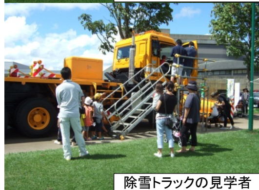
除雪トラックの見学者