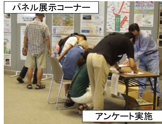
パネル展示コーナー