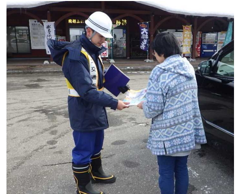
H29.12.15 啓発チラシ配布状況（道の駅 細入）

12月6日には富山河川国道事務所管内で初除雪を行っています。「スリップ事故」「坂を登れない」等で他の道路利用者の迷惑にならないよう、 雪道は安全走行をお願いします。