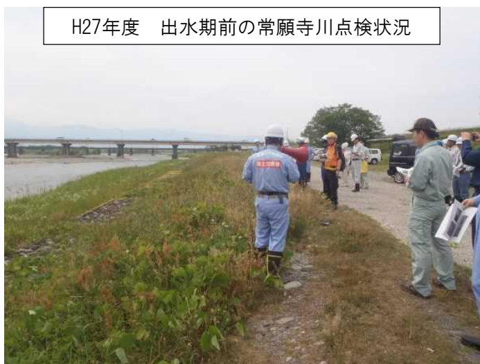
H27年度 出水期前の常願寺川点検状況