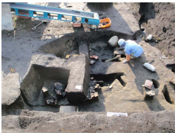
竪穴住居(縄文時代)