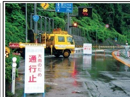
降雨による交通規制状況(富山市猪谷)