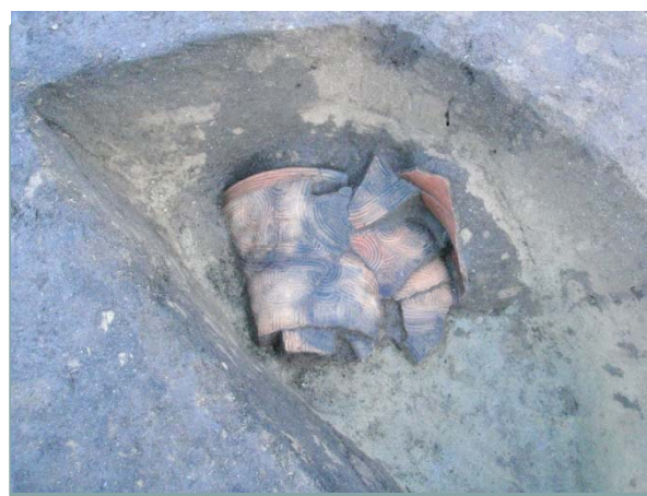
縄文土器(縄文時代)