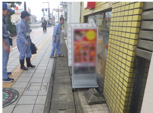
<昨年度の実施状況>