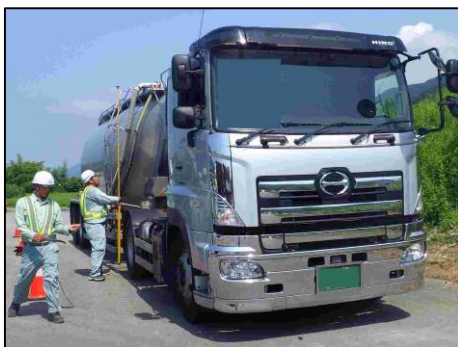
【過去の取締り 状況写真】