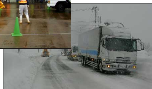
▲立ち往生車発生状況（国道41号富山市庵谷地先）