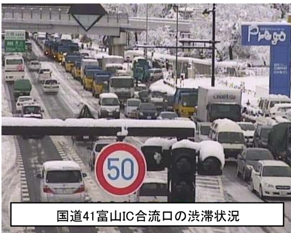
国道41富山IC合流口の渋滞状況