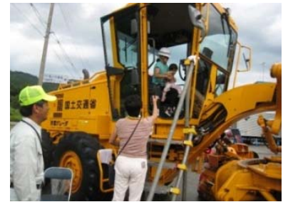
除雪車に試乗する子供達(昨年の様子)