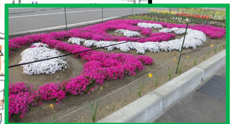
昨年秋に植えた花苗の様子 (平成30年4月現在)