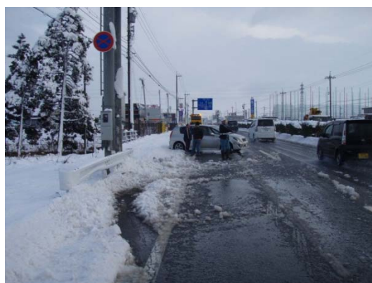
過去の事故状況写真