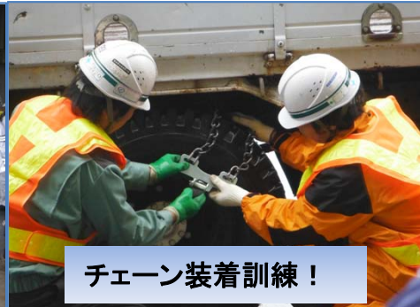
チェーン装着訓練！