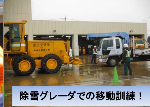
除雪グレーダーでの移動訓練！