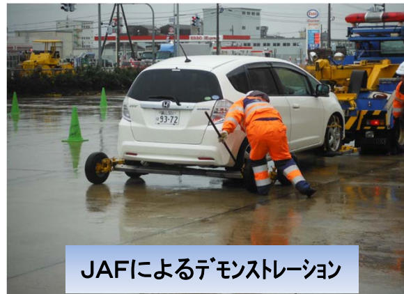
JAFによるデモンストレーション