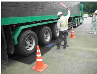
【過去の取締り 状況写真】