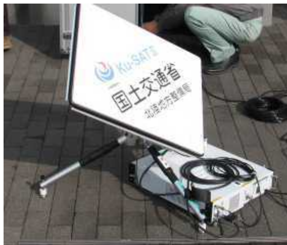
Ku-SAT II 設営状況