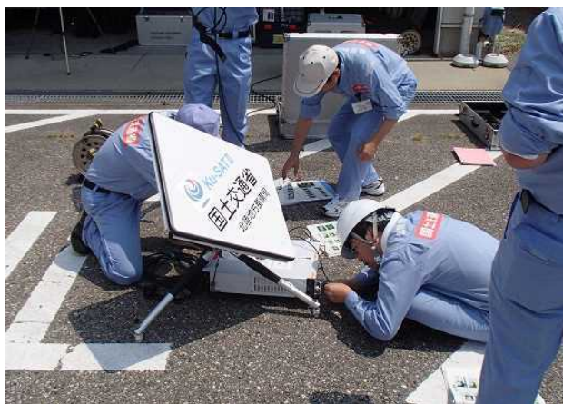
Ku-SAT II 設営作業