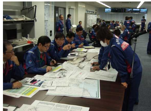
平成28年度 訓練実施状況