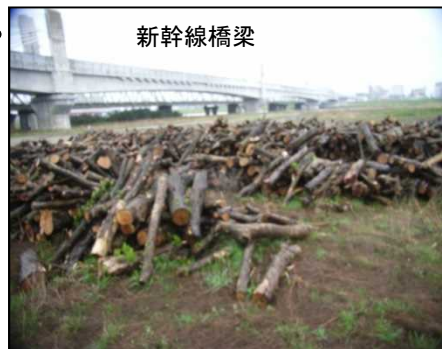
提供場所イメージ