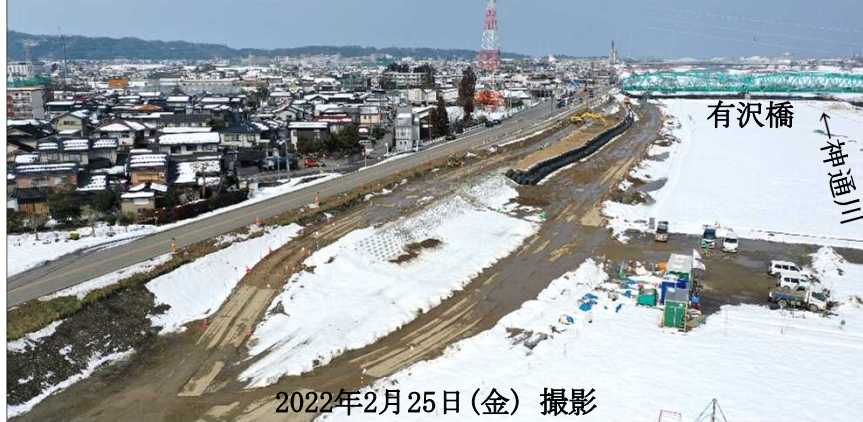
有沢工区 築堤・護岸施工箇所 神通川左岸9.8kp