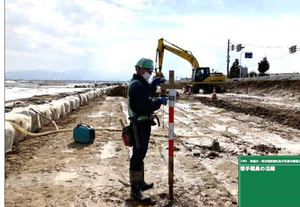
盛土施工管理状況