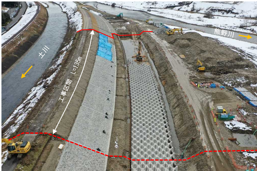
(2月1日撮影) 下流より