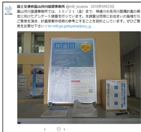
SNSによる 周知イメージ (過去の実施事例)