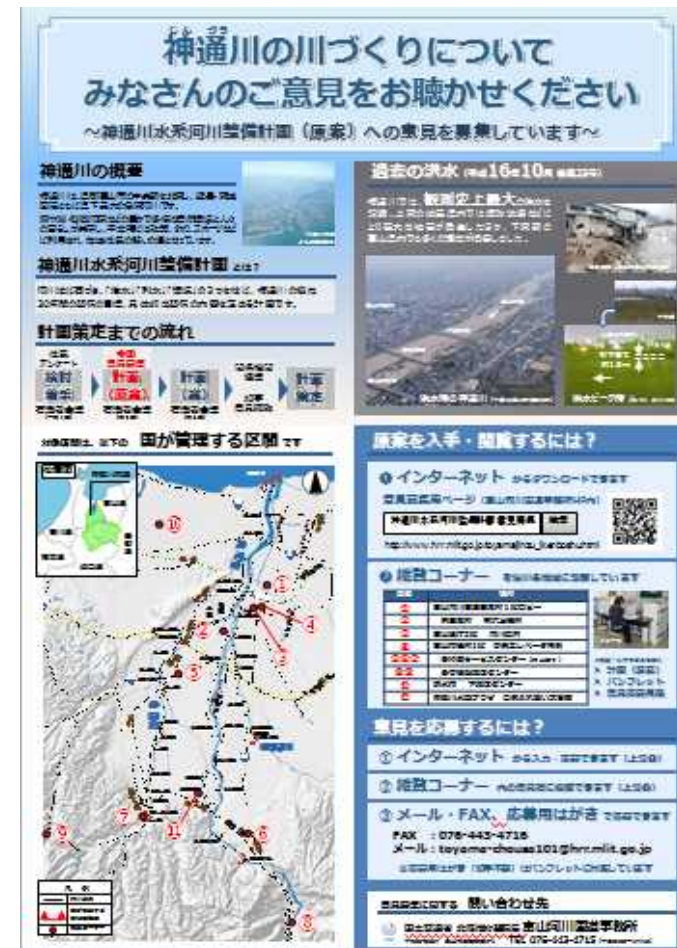
意見募集の周知ポスター イメージ