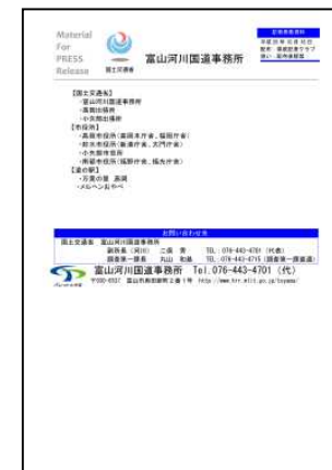
記者発表 イメージ (過去の実施事例)