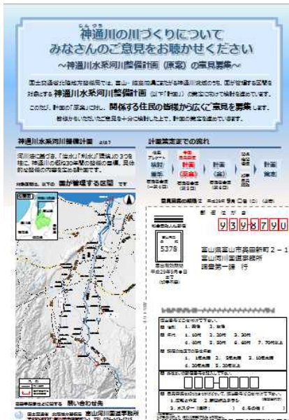
新聞折込み イメージ