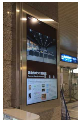
電子看板 （電鉄富山駅）