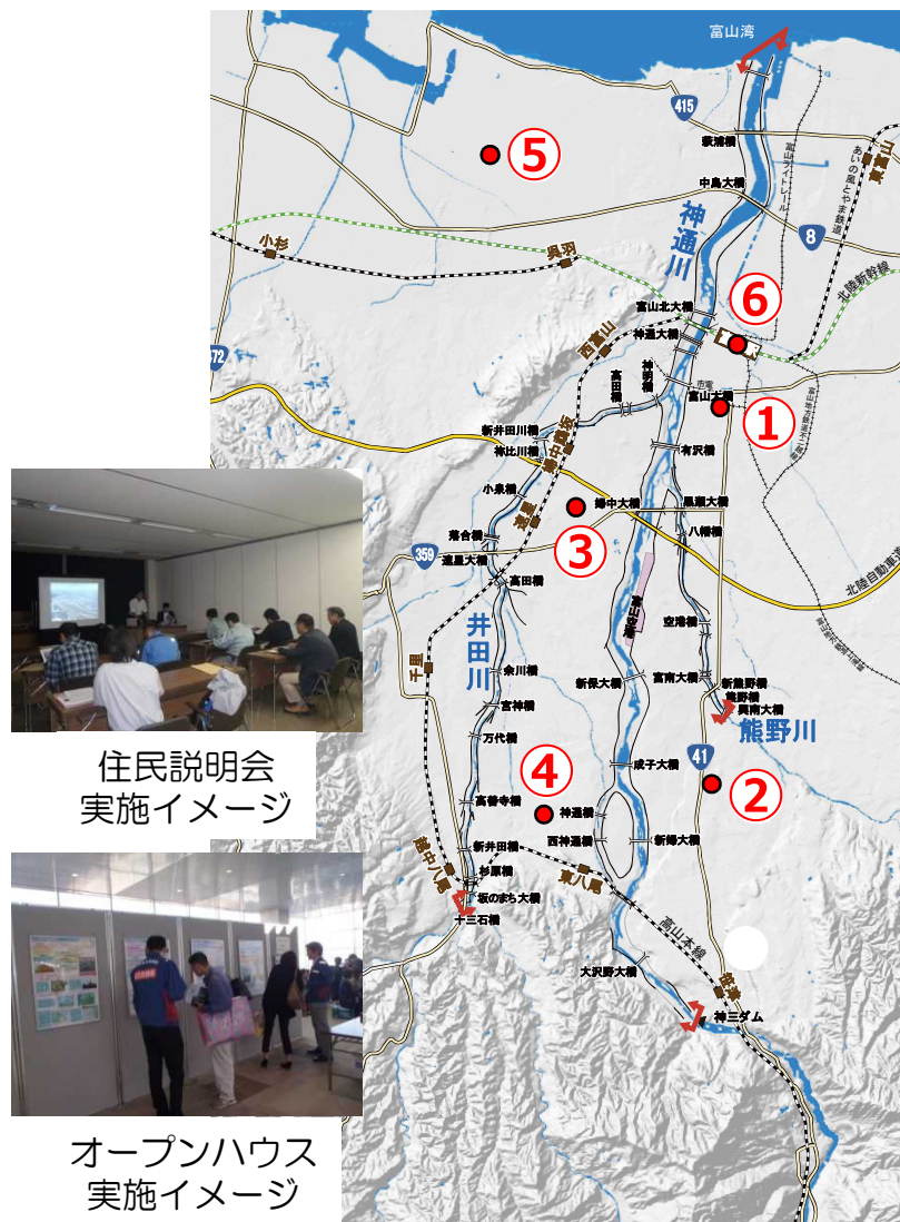
住民説明会 実施イメージ