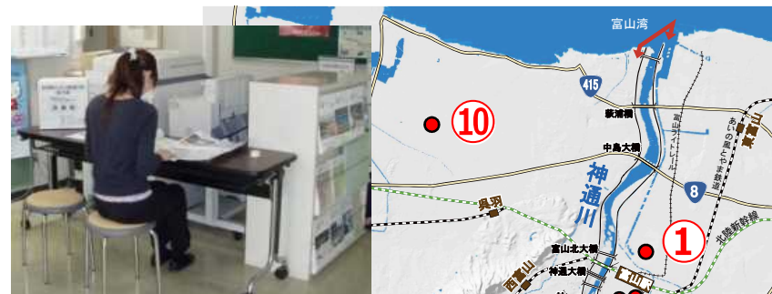
縦覧コーナー 設置イメージ