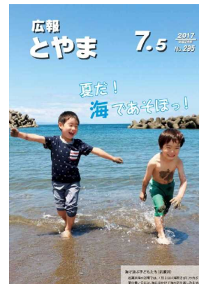
富山市広報誌「広報とやま」

これからの小矢部川の川づくり説明会 小矢部川を今後概ね30年間でどのように整備していくかを定める、河川整備計画の説明会を行います。計画の素案に対する皆さんの意見をぜひお聞かせください。入場無料、申し込み不要です。 なお、計画に対する意見は富山河川国道事務所のホームページでも募集しています。 とき 10月25日(土) 午前10時～ 場所 津沢コミュニティプラザ 問い合わせ 富山河川国道事務所 調査第一課 ☎076(443)4715