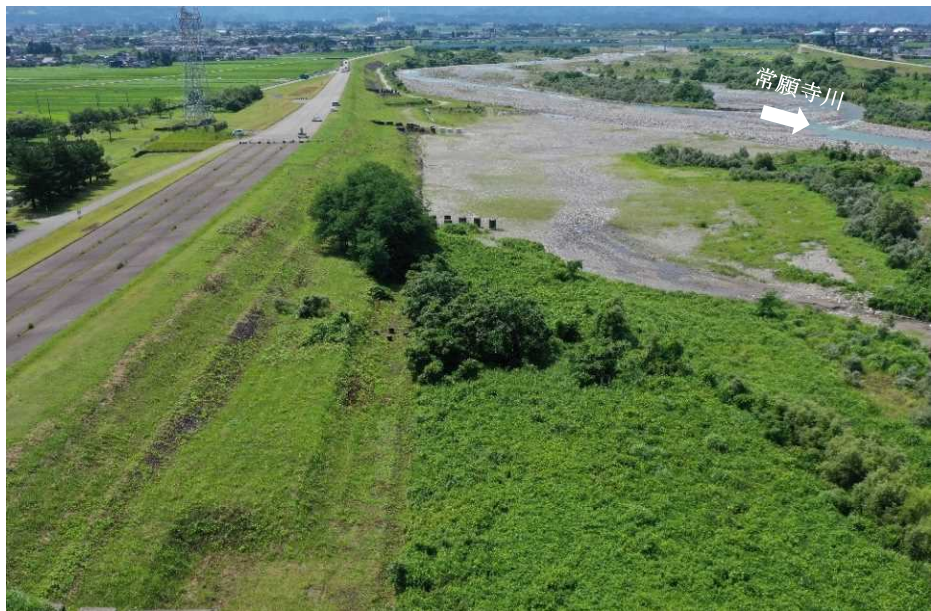
着手前 (下流より望む)