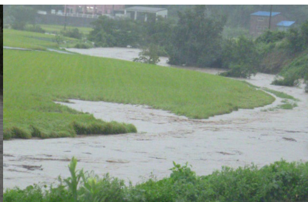
平成 25 年 9 月 子撫川