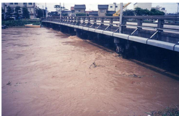
平成 10 年 9 月 白岩川