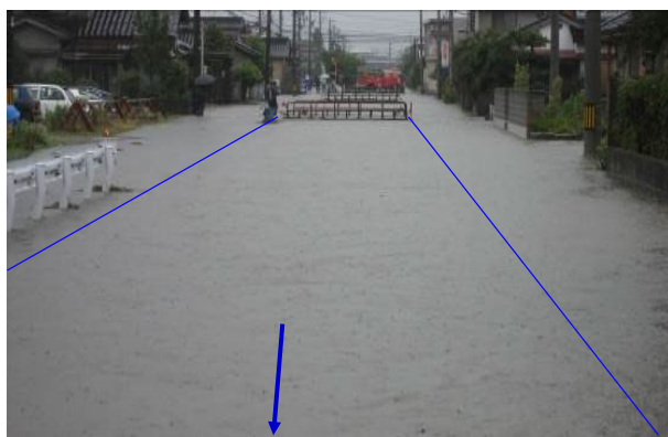
平成 20 年 7 月 坪野川