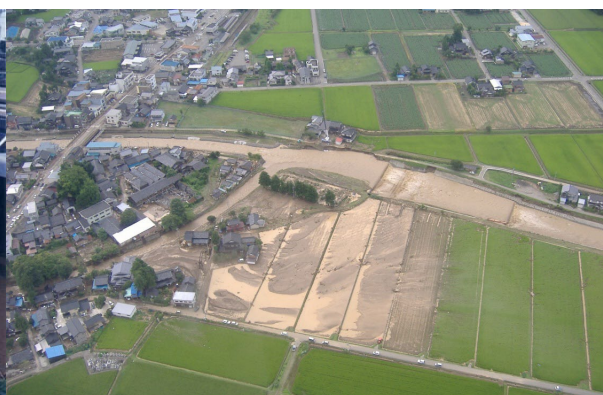
平成 20 年 7 月 小矢部川水系山田川