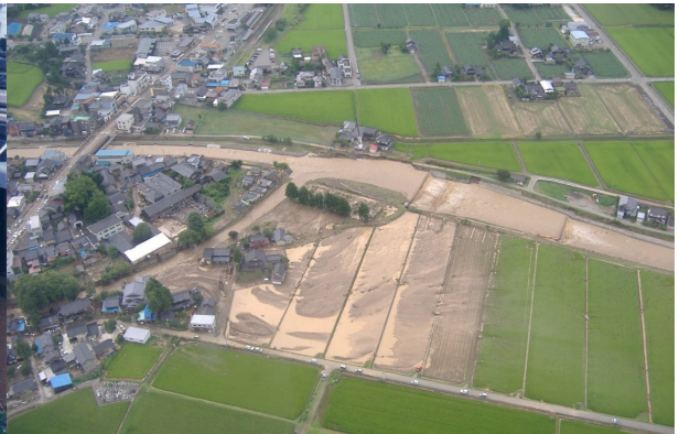
平成20年7月 小矢部川水系山田川