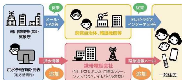
「洪水情報のプッシュ型配信」イメージ

配信エリア内の携帯電話等 （NTTドコモ、KDDI・沖縄セルラー、ソフトバンク（ワイモバイル含む））のユーザーを対象