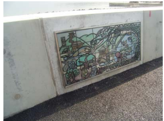
バス停横の擁壁面に設置