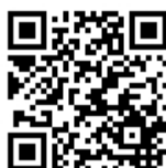
本日11時現在の状況