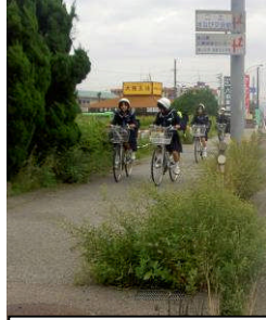
国道8号 高岡市向野本町地先