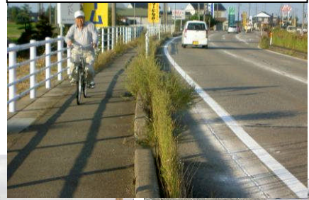
国道156号 高岡市行兼地先

○また、除草に関する相談・要望件数は、前年比で約1.3倍程に増加しており、道路利用者の除草に対する高い関心を示しています。 (H21.4～10:26件、H22.4～10:33件)