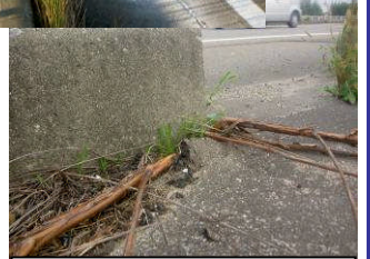
雑草生育により舗装が盛り上がっている状態