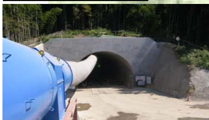
氷見北IC側トンネル坑口状況