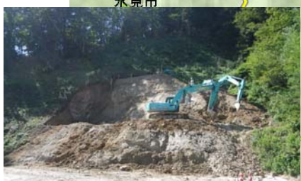
灘浦IC(仮称)側トンネル坑口状況