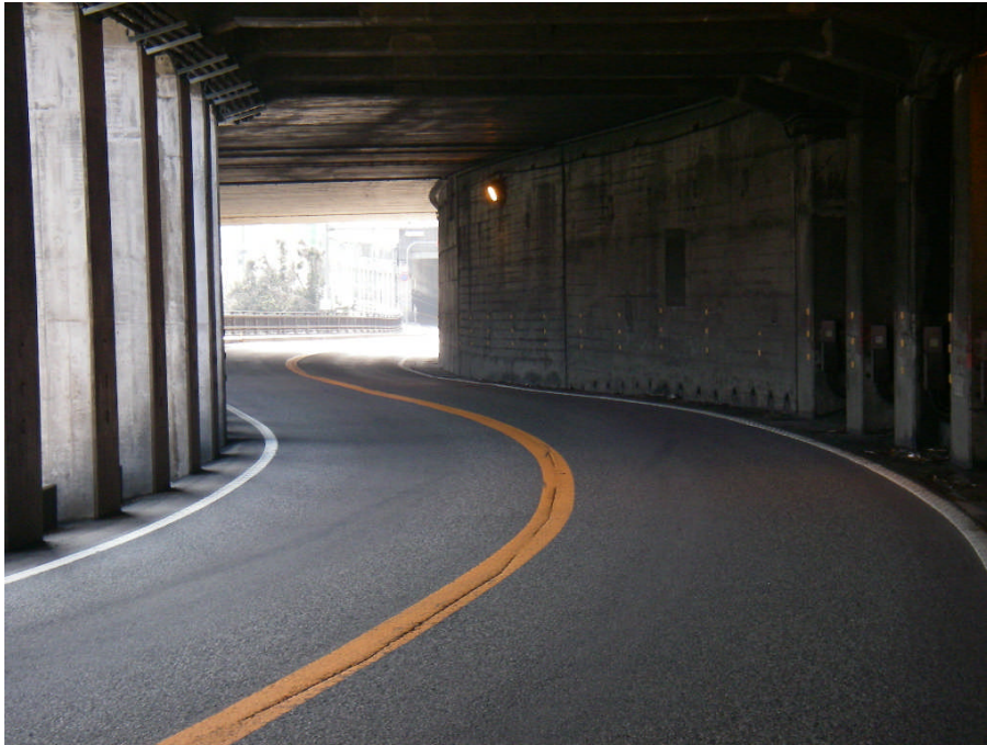
長良谷洞門 高山方向を望む