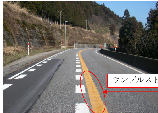
設置イメージ (富山市榆原地先)