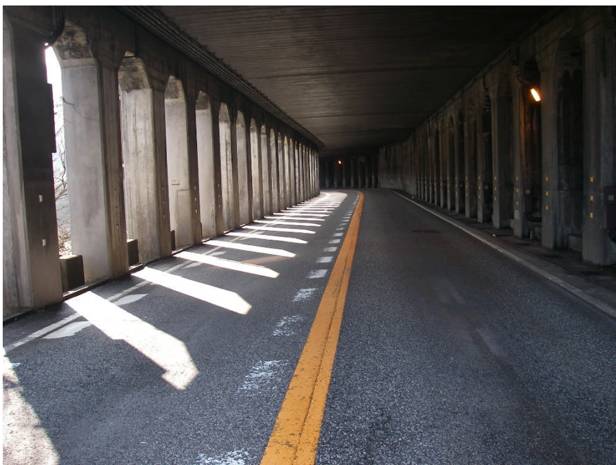
長良谷洞門 高山方向を望む